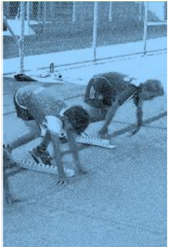
Impressionen & Infos www.sportlagersgtv.ch

Fr. 245.00 (2. Teilnehmer aus gleicher Familie Fr. 210.00)