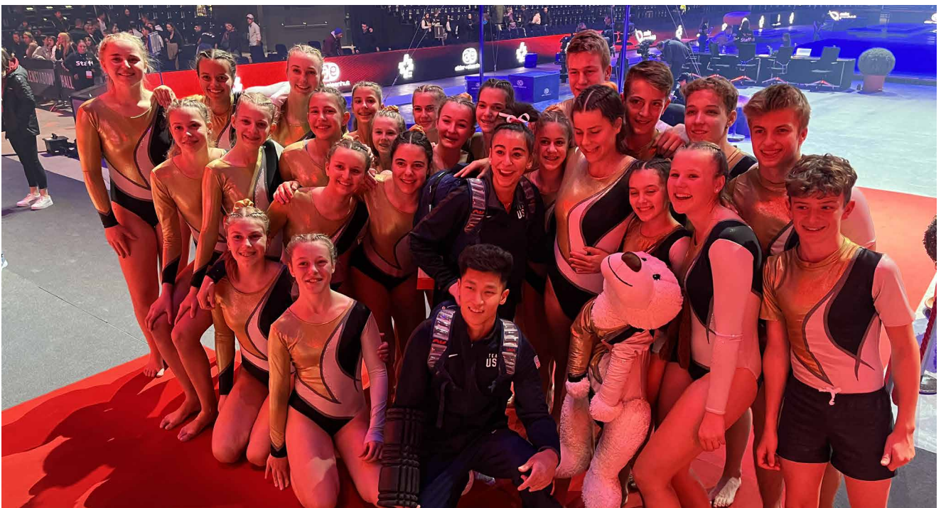
Balgacher Geräteturnerinnen und Geräteturner mit dem Siegerpaar