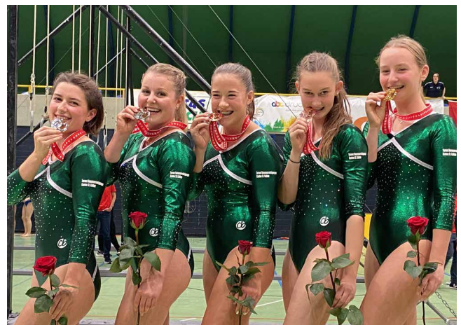
2022 Meisterinnen K5