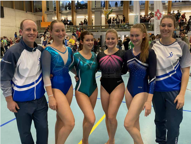
SM Einzel Tui Gruppenfoto mit Trainer