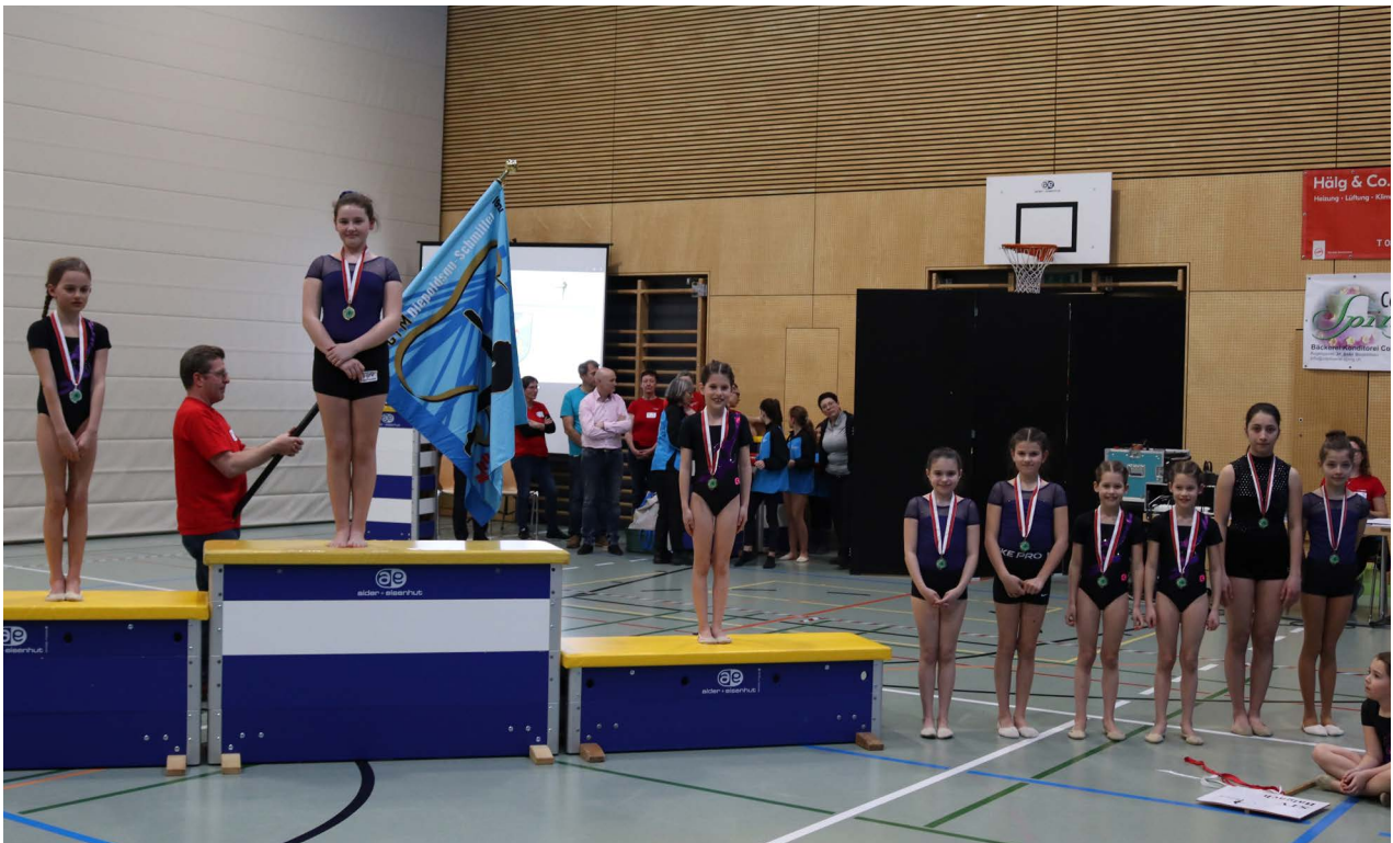
Nebst den drei Podestplätzen klassierten sich auch auf den weiteren Auszeichnungsrängen lauter Rheintalerinnen aus Balgach und Diepoldsau.