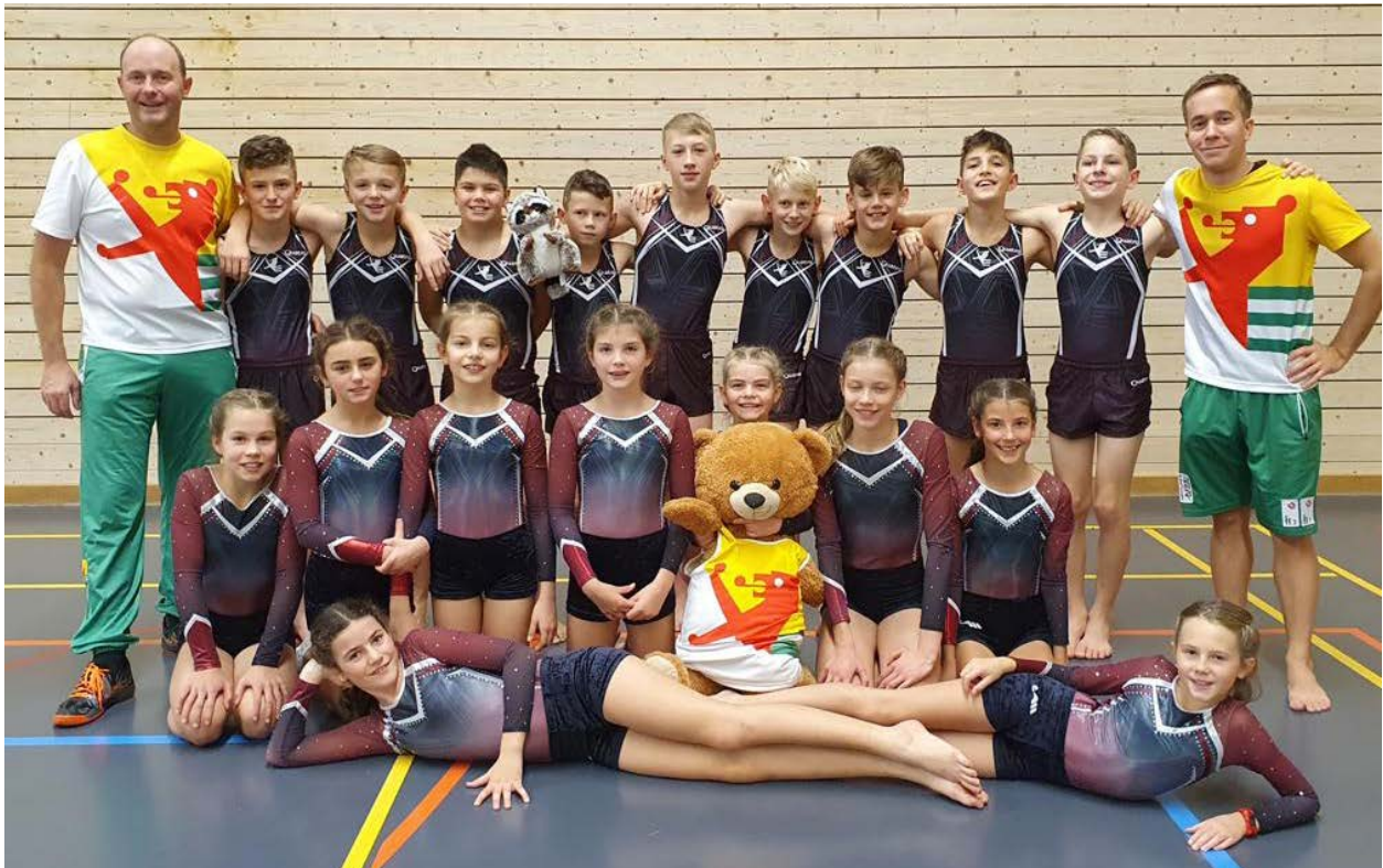
STV Balgach GETU Jugend B