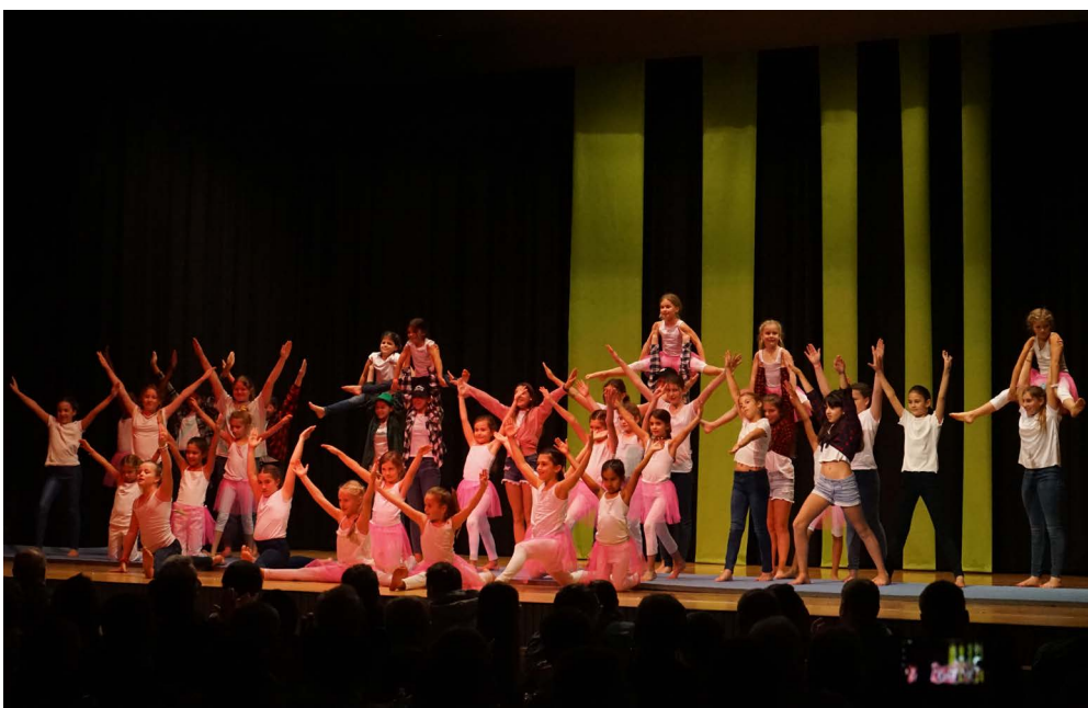
Viele Kids beim STV Au...