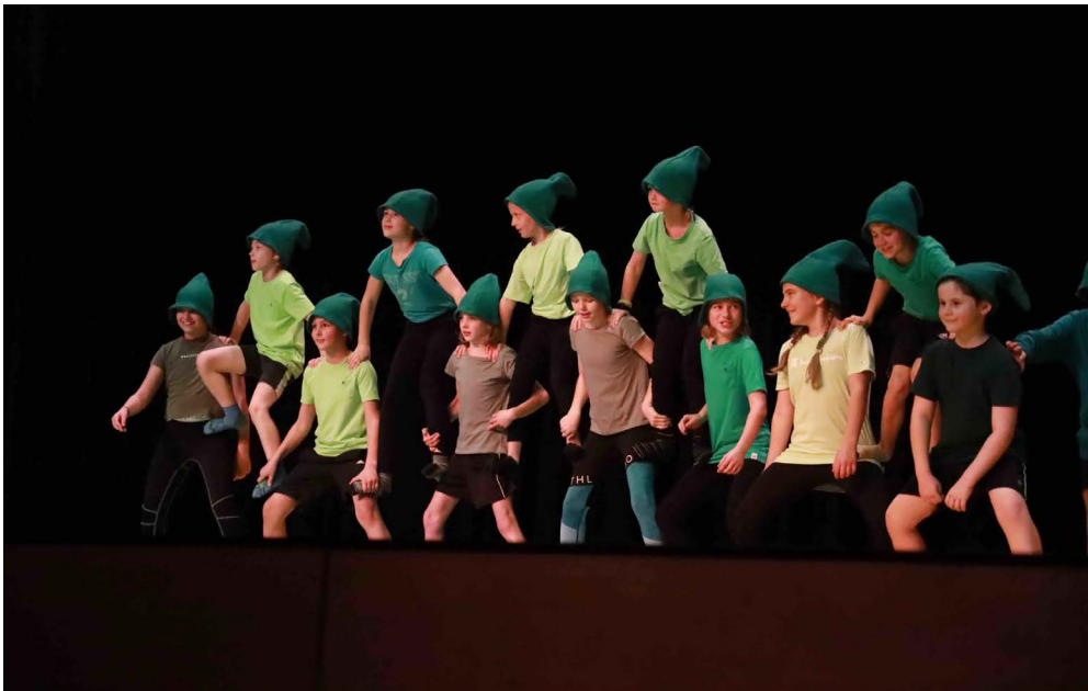
TV Staad im Einsatz...