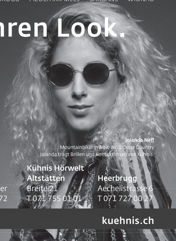
Jolanda Neff Mountainbikerin-Welt-Nr. 1 Cross Country Jolanda trägt Brillen und Kontaktlinsen von Kühnis.

Ihr führendes Fachgeschäft für Brillen, Linsen und Top-Service in der Region.