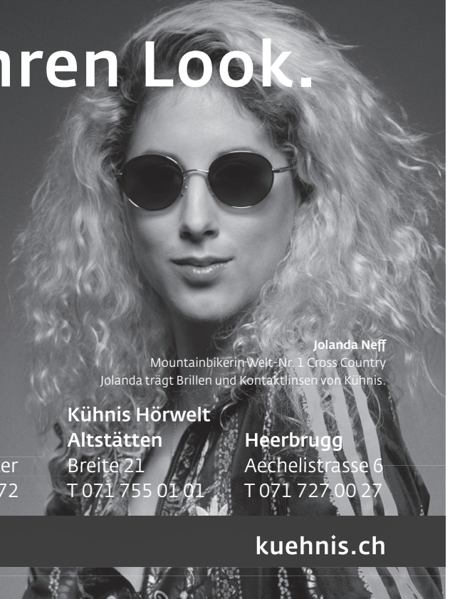
Jolanda Neff Mountainbikerin-Welt-Nr. 1 Cross Country Jolanda trägt Brillen und Kontaktlinsen von Kühnis.

Ihr führendes Fachgeschäft für Brillen, Linsen und Top-Service in der Region.