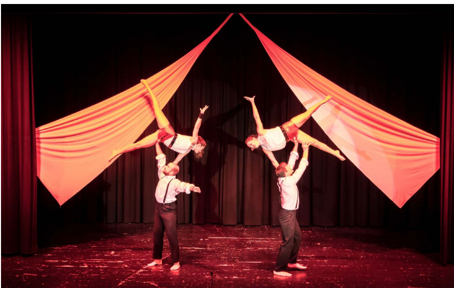
Der Showblock vom Turnverein Steinach