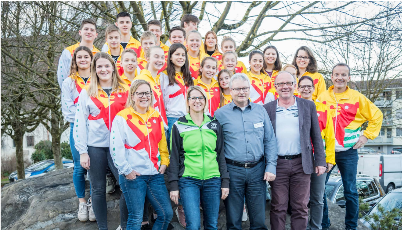
Vorne die geehrten Leiter für 15 bis 40 Jahre Leitertätigkeit. Hinten die Jugend des STV Balgach, welche erneut den Titel der SMJV im Boden holten.