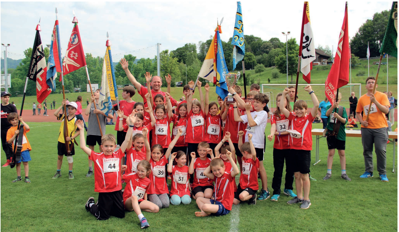
Die Sieger der Vereinsstafette: TSV Mörschwil mit dem neuen Wanderpokal