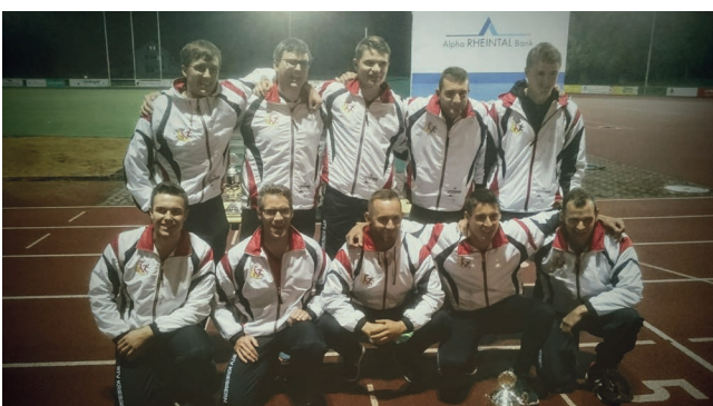
STV Kriessern gewinnt in der Kat. Herren