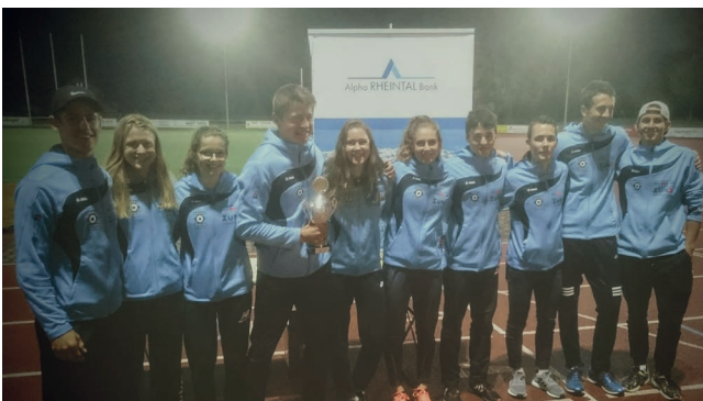
KTV Altstätten gewinnt in der Kat. Mixed

Gesamte Rangliste ist unter www.kreisturnverbandrheintal.ch zu finden.