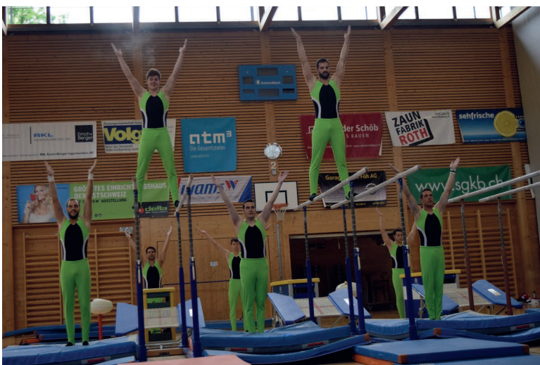
Die Barrenvorführung vom STV Kriessern