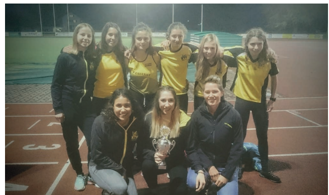
KTV Oberriet gewinnt in der Kat. Frauen