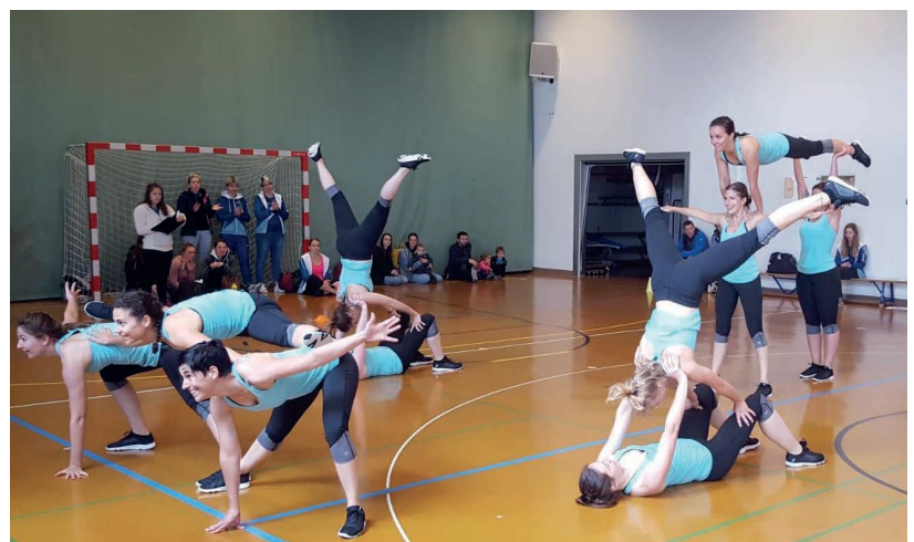
Team Aerobic vom STV Berneck beim Schlussbild