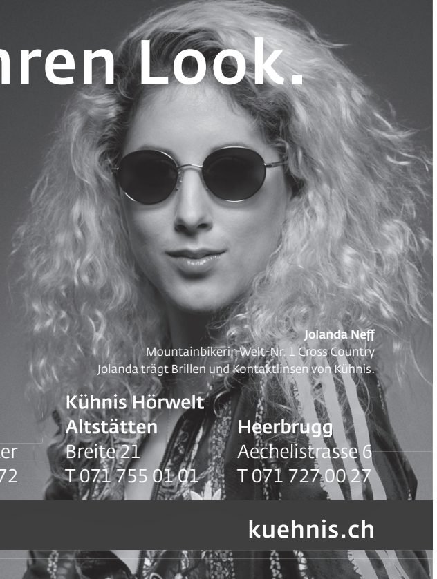
Jolanda Neff Mountainbikerin-Welt-Nr. 1 Cross Country Jolanda trägt Brillen und Kontaktlinsen von Kühnis.

Ihr führendes Fachgeschäft für Brillen, Linsen und Top-Service in der Region.